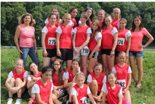
Leichtathletik: TN am Länderfinale Bodenseeschulcup Mittelschule Vilsbiburg

Aber nur im Zusammenwirken mit starken Partnern können die Schulsportwettbewerbe „Jugend trainiert für Olympia“ bundesweit, der „Bodenseeschulcup“ sogar international oder auch die anderen Mannschaftswettbewerbe durchgeführt werden. Dabei erfahren die Organisatoren vor Ort großzügige und wichtige Unterstützung durch die Sparkassen. Einen großen Beitrag zur Erfolgsgeschichte der Schulsportwettbewerbe leisten insbesondere die Vereine und Fachverbände des Bayerischen Landessportverbandes mit ihren Trainern und Übungsleitern und durch ihre Sportanlagen.