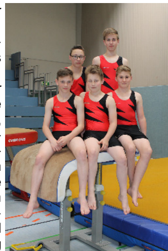
Gerätturnen: TN Rhein-Main-Donau Schulcup Länderfinale Sportmittelschule Hauzenberg

„Gemäß dem Motto: „ Nur gemeinsam sind wir stark! “, ist die Leistung einer Mannschaft mehr als die Summe der Einzelleistungen. Damit fördern die Schulsportwettbewerbe auf äußerst motivierende und attraktive Art und Weise, Werte und Tugenden, die nicht nur für eine sozial intakte Gemeinschaft unabdingbar sind, sondern auch eine zentrale Voraussetzung für den späteren beruflichen Erfolg darstellen. Die Schulsport-Wettbewerbe unterstützen damit ein wichtiges Ziel des Sportunterrichts an bayerischen Schulen: die jungen Leute zu lebenslangem, außerschulischem Sporttreiben zu motivieren. Vor diesem Hintergrund ist die Bedeutung der Schulsportwettbewerbe gar nicht hoch genug einzuschätzen“, betonen der Bayerische Staatsminister für Unterricht und Kultus, Wissenschaft und Kunst Dr. Ludwig Spaenle und Staatssekretär Georg Eisenreich in ihrem Vorwort zur Broschüre „Schulsportwettbewerbe in Bayern 2015/16“ die wichtigen Werte, die durch den Sport vermittelt werden können. Diese Wettbewerbe zeigen vor allem auch die große Einsatzbereitschaft und Kompetenz unserer Sportlehrkräfte und Schulleitungen in Bayern.