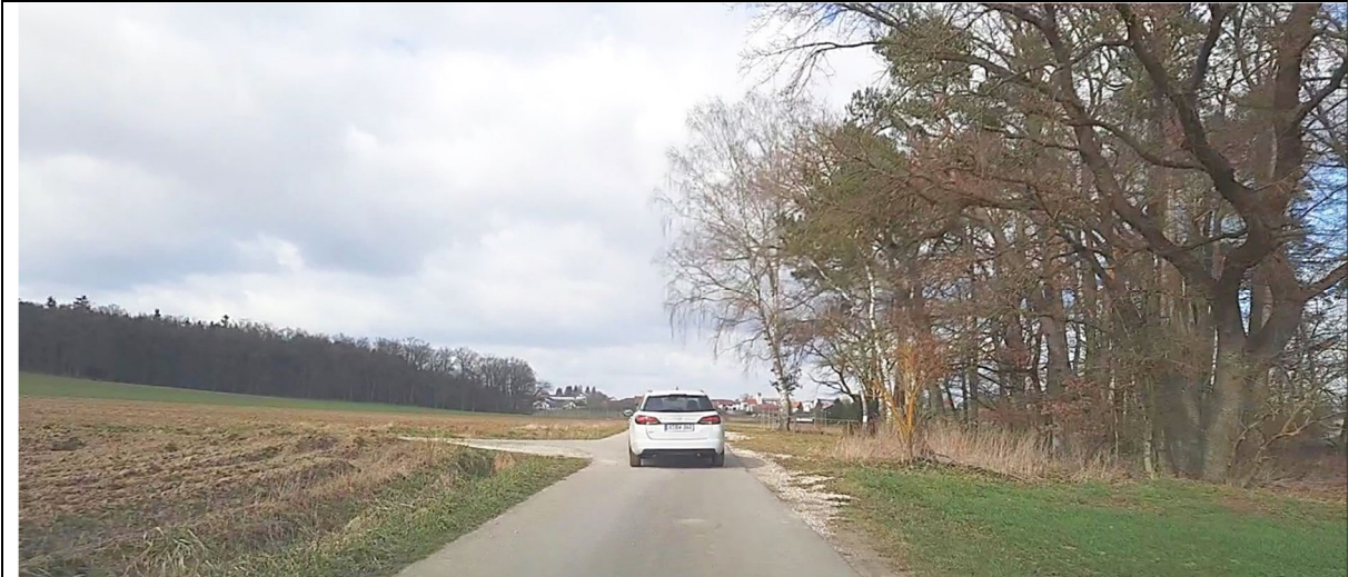
Bild 2: Standort bei Bau-km 0+025 mit nördlicher Blickrichtung auf ländlichen Weg